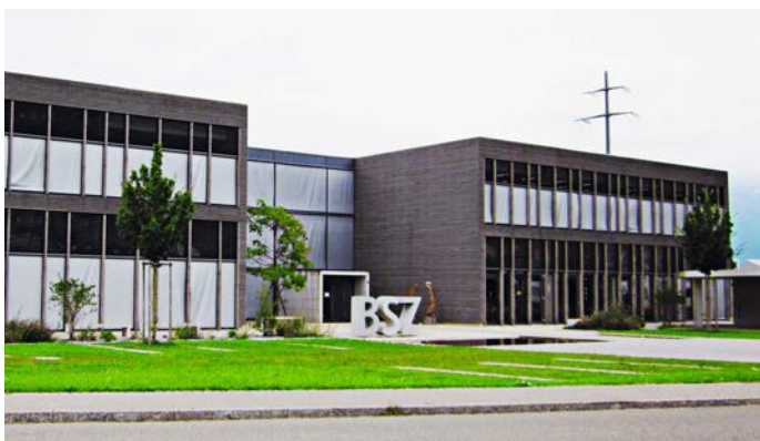
BSZ Stiftung in Schübelbach