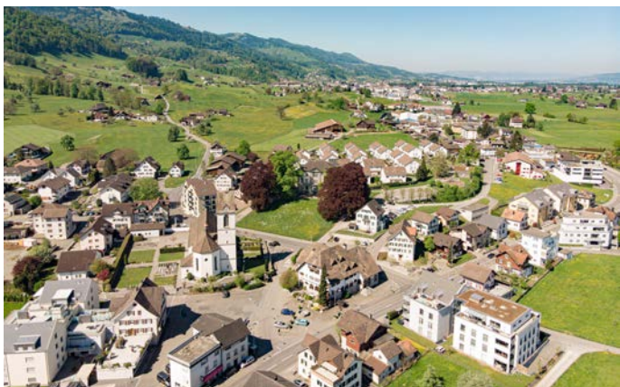
Dorfansicht von Schübelbach