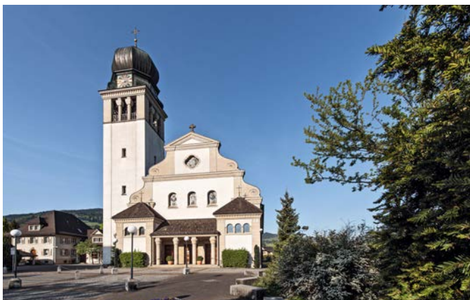
Katholische Kirche Siebnen