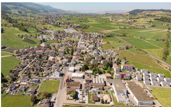
Dorfansicht von Buttikon