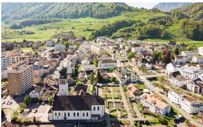
Dorfansicht von Siebnen