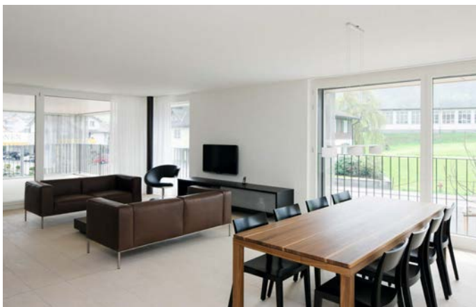
Gebäude der Stiftung Phönix in Buttikon