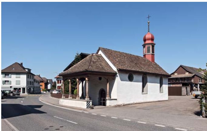
St. Nikolaus Kapelle in Siebnen